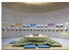
コタツを設置した読書空間、ホワイエ。

動物とともに・動物について考える本を50冊選びました。哲学館ホワイエに期間限定の読書空間が出現します。本を手にとり、読んで、考えてみてください。